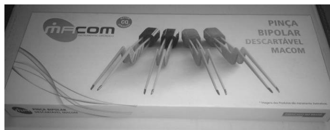
Forma de apresentação / Embalagem externa (caixa de papel cartão tipo cartucho)

As instruções de uso não estão impressas na embalagem sendo apresentado em um impresso à parte, dentro da embalagem do produto.