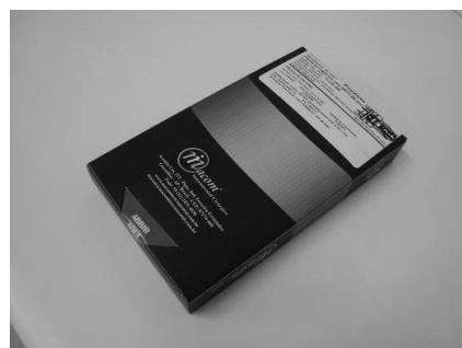
Cartucho de papel cartão, envolvida e selada em filme poliolefínico termo encolhível